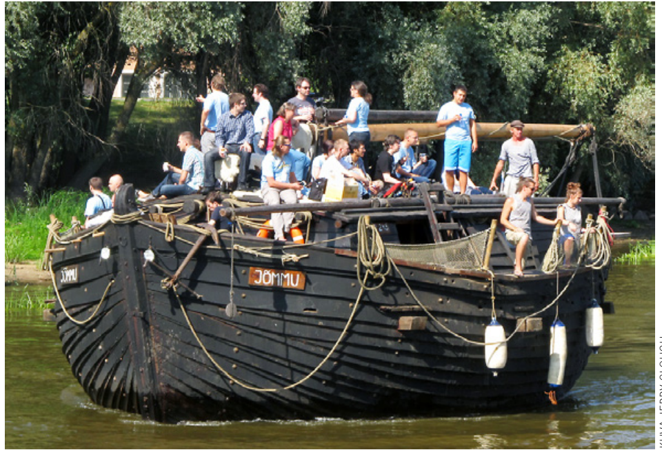
Tartossa elokuussa 2013 pidetyn State of the Map Baltics -tapaamisen osallistujia.

Wikipedia on maailman viidenneksi luetuin verkkopalvelu, jonka kaikki kävijät ovat mahdollisia osallistujia. Uskomme, että tarjoamalla kävijöille haasteita, joita toteuttamalla he edistävät omia päämääriään, voimme rakentaa luovalle vuorovaihtukselle perustuvaa yhteismaata.